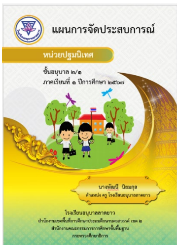
กำหนดการจัดประสบการณ์ ชั้นอนุบาลปีที่ ๒ เทอมที่ ๑ ปีการศึกษา ๒๕๖๗ โรงเรียนอนุบาลลาดยาว สำนักงานเขตพื้นที่การศึกษาประถมศึกษานครสวรรค์ เขต ๒